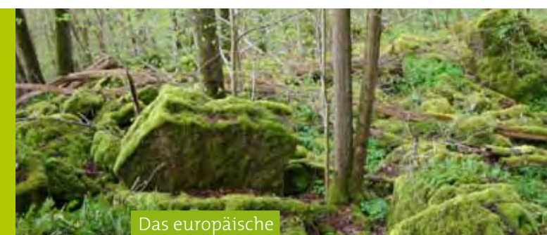
Das europäische Natura 2000 Netzwerk

Herzstück der Manternacher Fiels ist der Schluchtwald, der rund 57 ha umfasst und 24% der gesamten Schluchtwaldfläche Luxemburgs darstellt. Er ist flächenmäßig der größte Schluchtwald in Luxemburg und wird seit etwa 50 Jahren waldbaulich nicht mehr bewirtschaftet. Menschliche Eingriffe im Waldgebiet beschränken sich lediglich auf die Frei- und Offenhaltung der Wanderwege. Seit 2012 ist die Manternacher Fiels offiziell ein Naturwaldreservat.