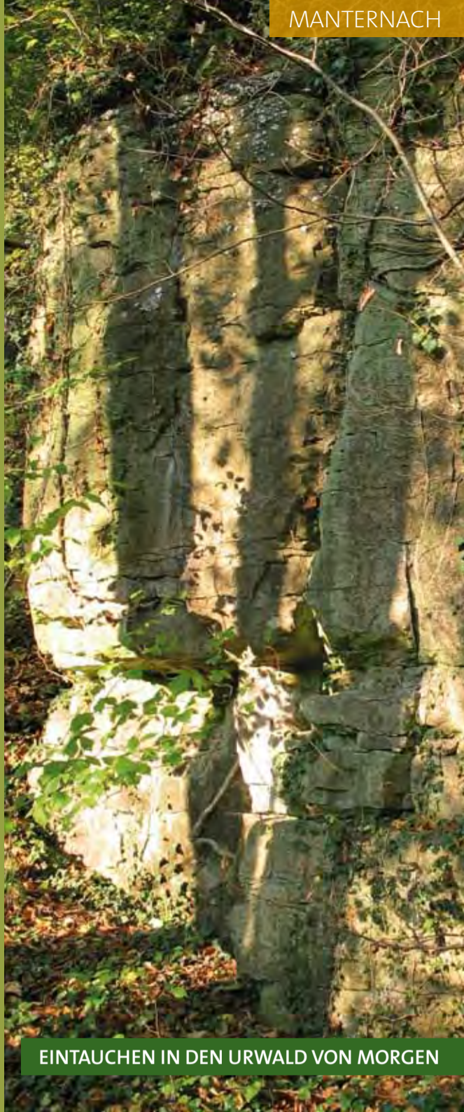
EINTAUCHEN IN DEN URWALD VON MORGEN