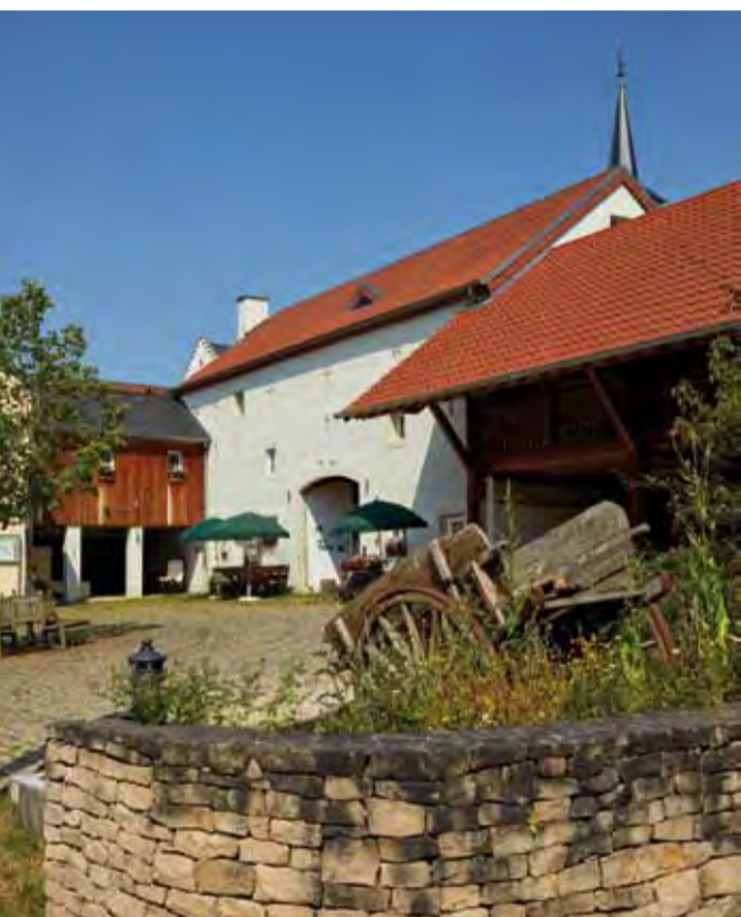
Startpunkt des Lehrpfads beim Naturschutzzentrum A Wiewesch