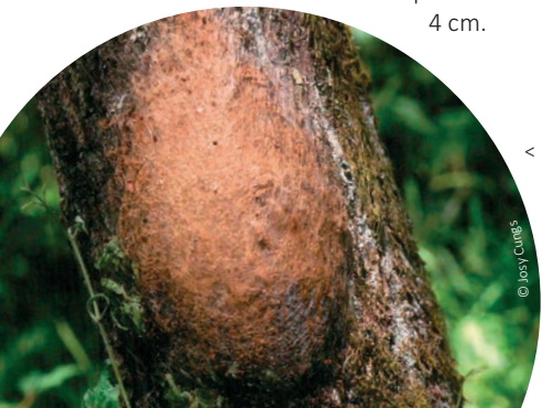
< Gespinst des Eichenprozessionsspinners

Zahl und Länge der Brennhaare nehmen mit jeder Häutung zu. Bis zum Ende des sechsten Larvenstadiums erreichen die Raupen eine Körperlänge von bis zu 4 cm.