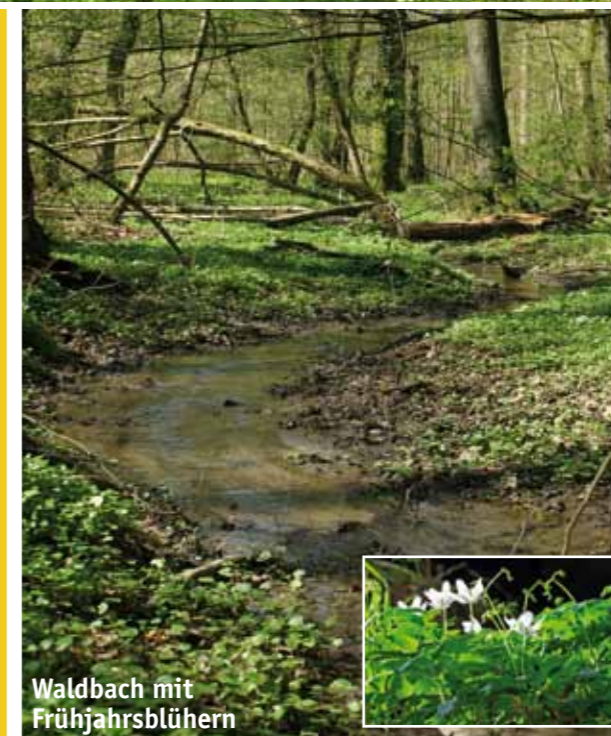
Waldbach mit Frühjahrsblühern