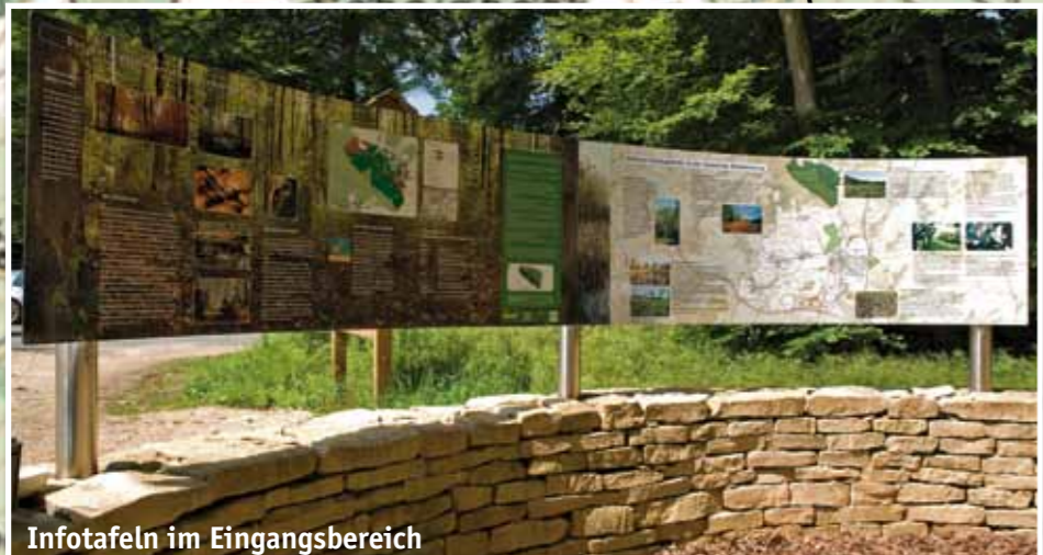
Infotafeln im Eingangsbereich