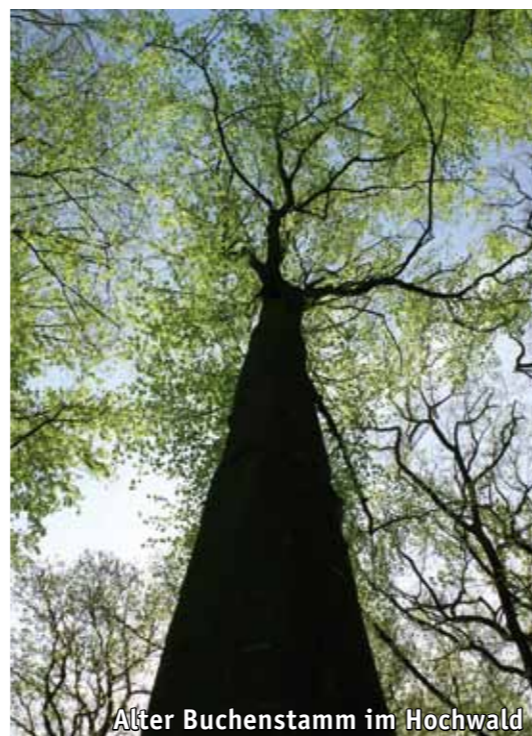
Alter Buchenstamm im Hochwald