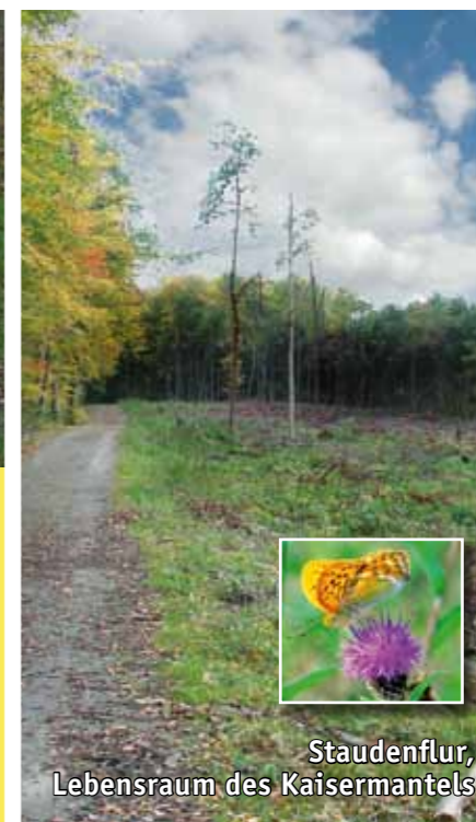
Staudenflur, Lebensraum des Kaisermantels

Mitten im „Enneschte Bësch“ verbergen sich mehrere meist flache Tümpel, sogenannte Mardellen. Diese flachen Dellen fallen sommerlich oft trocken, weshalb Sie vom Menschen oft nachträglich eingetieft wurden, um ein dauerhaftes Gewässer zu erhalten. Entlang des Weges können Sie zwei vertiefte, ganzjährig wasserführende Mardellen entdecken, die zahlreichen Waldamphibien wie dem Berg-, Faden- und Teichmolch zum Abläichen dienen.