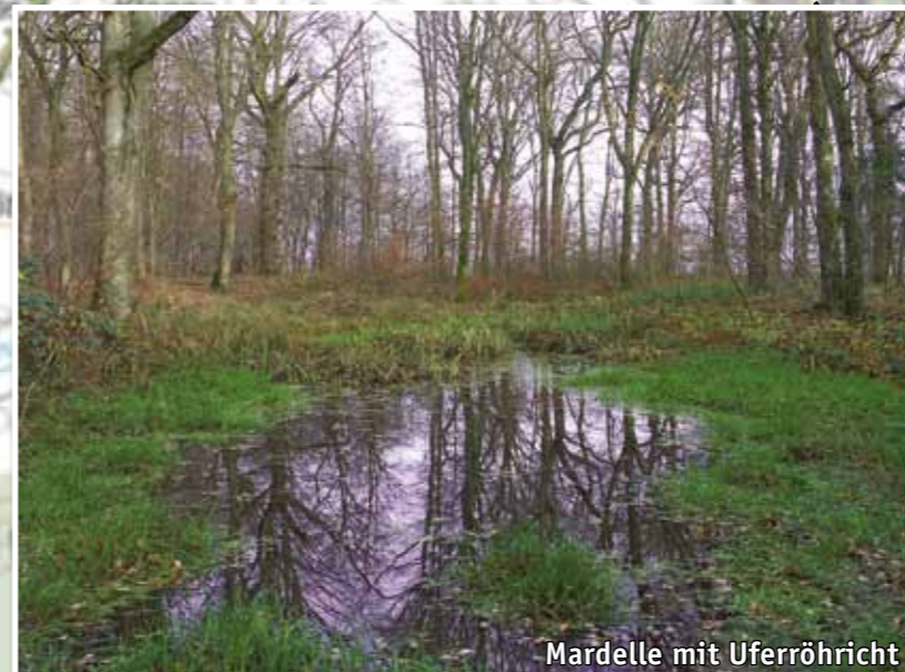
Mardelle mit Uferröhricht