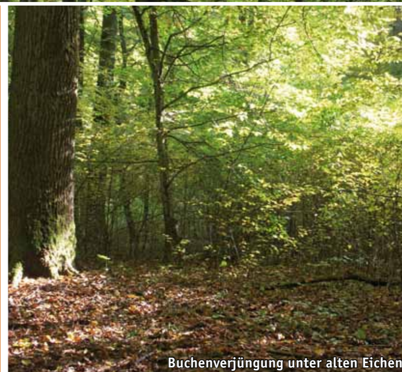
Buchenverjüngung unter alten Eichen

Noch heute spiegelt der „Enneschte Bësch“ mit seinen großkronigen Stieleichen und den lichten Hainbuchen die frühere Nutzungsform wider. Über Jahrhunderte wurde der Waldbestand als Mittelwald genutzt: die mächtigen Stämme freistehender Eichen dienten als Bau- und Möbelholz, die Hainbuchen in der Baumschicht darunter wurden in kurzen Abständen (15 - 30 Jahre) als Brenn- oder Industrieholz eingeschlagen. Die Hainbuchen trieben dann aus dem Wurzelstock wieder aus. Besonders entlang der Waldwege im nördlichen Bereich des Naturwaldreservates können Sie die alten Eichen mit ihren ausladenden Kronen bewundern.