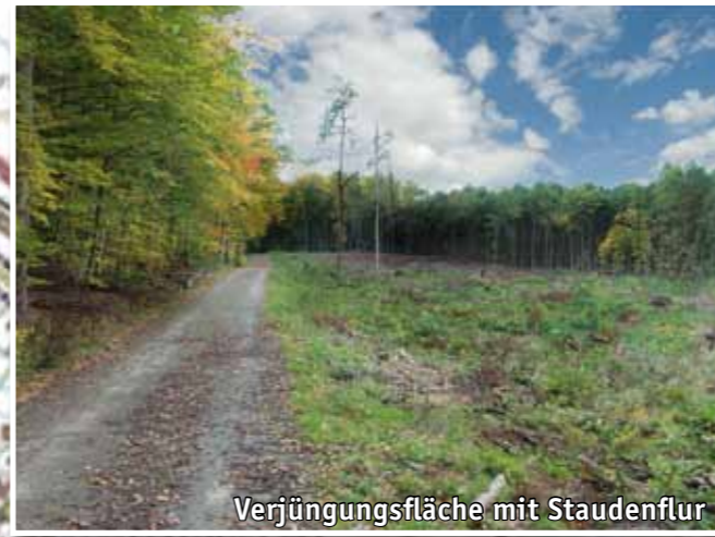
Verjüngungsfläche mit Staudenflur