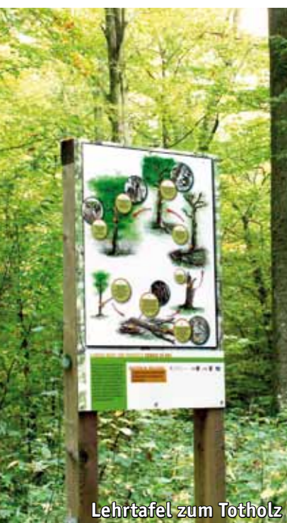
Lehrtafel zum Totholz