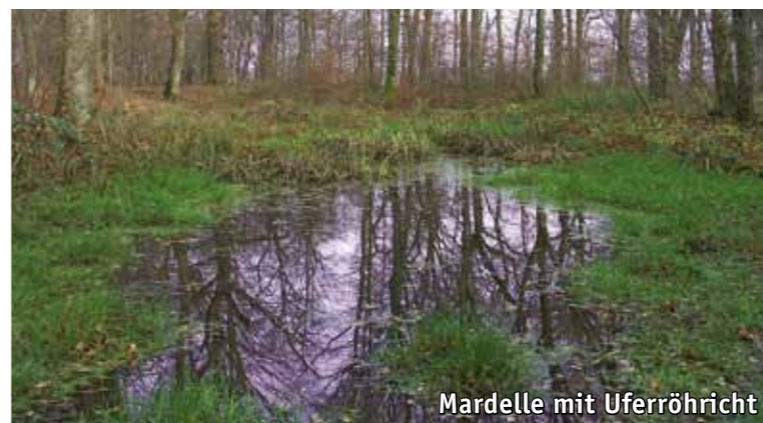
Mardelle mit Uferröhricht

Der „Enneschte Bësch“ mit seinem alten Baumbestand beherbergt schon heute bemerkenswerte Tierarten: Die seltene Bechsteinfledermaus wurde hier nachgewiesen. Auch die Spechte (Kleinspecht, Grünspecht, Mittelspecht) und Greifvögel (Habicht, Rotmilan, Schwarzmilan) fühlen sich in den großkronigen Altbäumen wohl. Achten Sie auf die Vielfalt der Tier- und Pflanzenwelt, Sie werden in jeder Jahreszeit andere Entdeckungen machen.